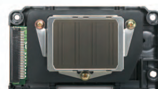
Tête d'impression identique à celle des imprimantes grand format Epson