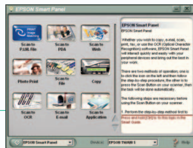
EPSON Smart Panel-interface